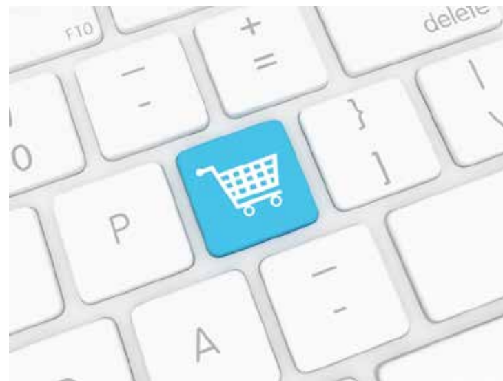
Os algoritmos podem criar perfis, direcionar publicidade e até prever certos comportamentos do usuário.

Todavia, mais transações online trazem alguns problemas que merecem ser mencionados. Aumento do fluxo de tratamento de dados pessoais; o risco de ataques cibernéticos; o aumento dos riscos de fraudes por engenharia social e do risco de incidentes com dados pessoais, entre outros. As maiores empresas do mundo hoje em dia têm como seu negócio principal o tratamento de dados pessoais, assim temos o