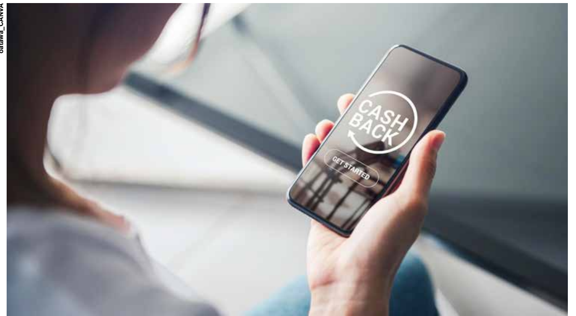
O cashback deve ser adotado cada vez mais pelas empresas no Brasil.

Outro ponto é a fidelização dos clientes, uma vez que ele passa a não adquirir apenas um produto, mas a ganhar uma recompensa a cada compra. “Ao recompensar os consumidores que vão diariamente a mercados de