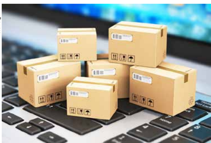
A logtech foca nas soluções para melhoria da entrega de uma determinada empresa e não na execução da entrega em si.

O mesmo raciocínio vale aos aplicativos de entrega de comida, uma das áreas que mais cresceram entre as logtechs nos últimos anos. As startups de entrega receberam mais de 70%