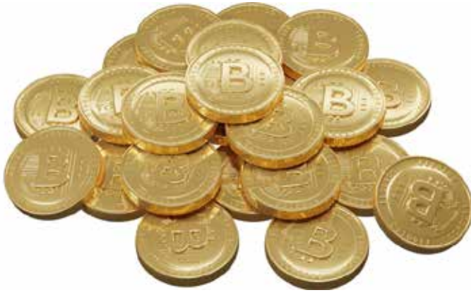
A moeda digital do BC será uma expressão da nossa moeda soberana.