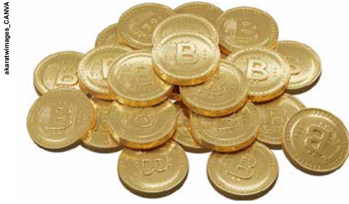
A moeda digital do BC será uma expressão da nossa moeda soberana.

Diferentemente das moedas digitais tradicionais, como o Bitcoin, o Real Digital terá o lastro e a garantia do BC e do governo brasileiro, como ocorre com o dinheiro físico. “A diferença é que, enquanto as moedas digitais tradicionais são privadas, as CBDCs são emitidas por bancos centrais e possuem