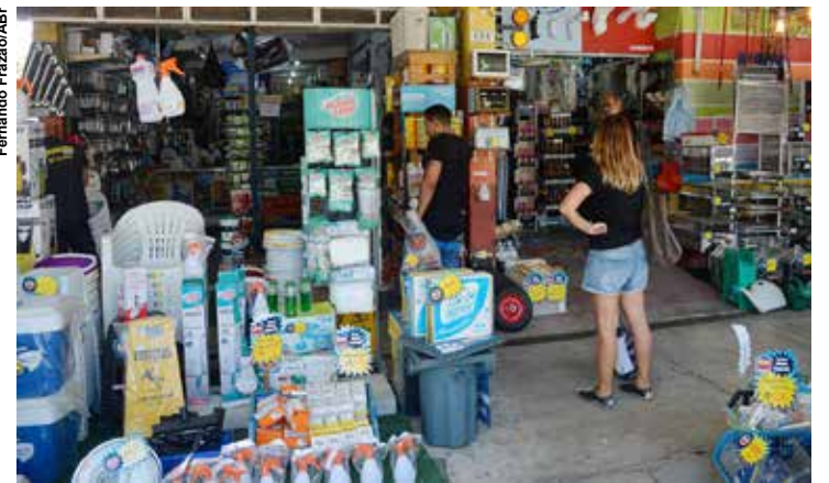
As lojas de rua lideraram a alta, com um crescimento no faturamento de 23%.

apontam que a retomada do fluxo aconteceu a partir de fevereiro, pois em janeiro a queda no movimento das lojas de rua era de 46% e de 40% nos shoppings, na comparação com o mesmo período em 2019. Desde o segundo mês do ano, os números vinham reduzindo a distância da queda de movimento e se aproximando dos níveis pré-pandemia.