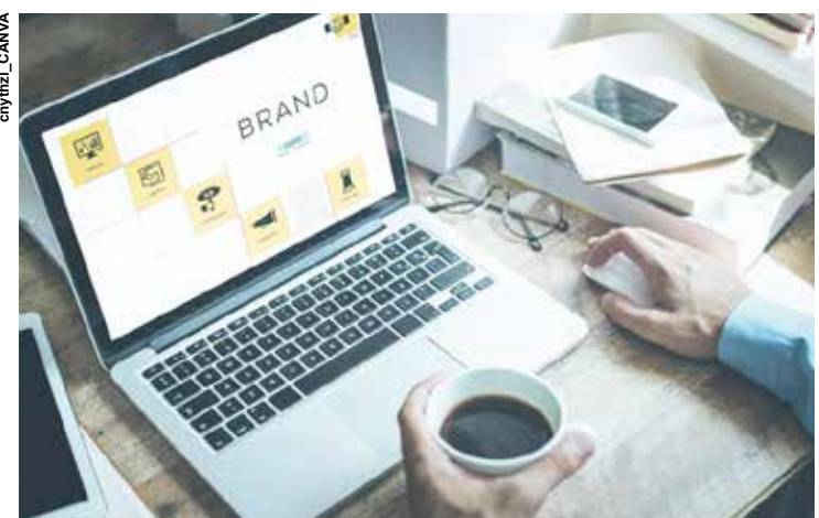
As pessoas tendem a respeitar pessoas autoconfiantes, e isso gera reputação e oportunidades.

Bonoldi afirma que, na construção de sua marca, é fundamental praticar e cultivar o autoconhecimento, de modo a saber quais são seus